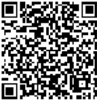
වැඩි විස්තර සඳහා කරුණාකර ඉහත QR කේතය පරීක්ෂන්න.

මෙම නඩුවේදී, කලින් හඳුනාගත් ඇතැම් සිරකරුවන් ඝාතනය කිරීමට සංවිධානාත්මක මෙහෙයුමක් දියත් වූ බව අනාවරණය වූ අතර සිරකරුවන් 27 දෙනෙකු ඝාතනය කළ අතර සිරකරුවන් හතළිස් දෙනෙකු තුවාල ලැබීය. මෙම නඩුව ද වින්දිතයන් සහ සාක්ෂිකරුවන්ට පුළුල් ලෙස බිය ගැන්වීම් සහ වූදිනයන් දේශපාලන පළිගැනීම්වලට ගොදුරු වූවන් ලෙස පෙන්වීමට උත්සාහ කර ඇත.